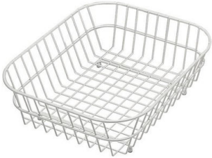
Cesta blanca de acero inoxidable 8612 000