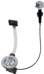
Desagüe automático LIRA 8407 103