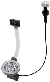
Desagüe automático 8407 100