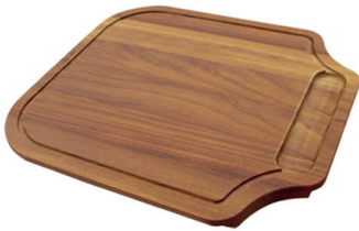
Tabla de corte de madera Iroko 8655 000